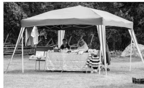
Vid Hembygdens dag invigdes de nya paviljongerna. Denna gång behövdes de inte för någon otrevlig nederbörd.

Som traditionen bjuder började dagen med friluftsgudstjänst och fortsatte med folkdans i dubbel tappning.