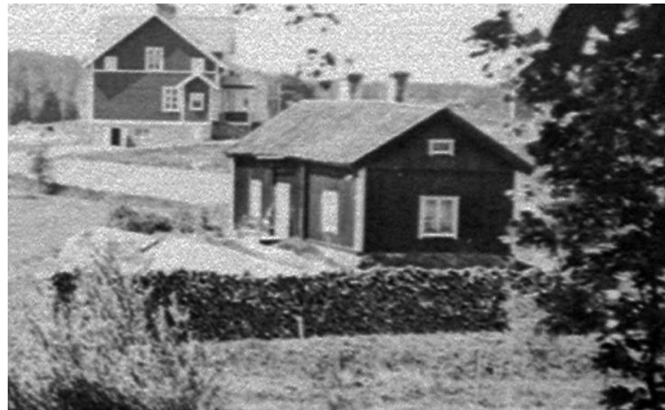
Odensala fattigstuga ca 1930. Bilden är beskuren.

Sveriges befolkning under denna period var ca 4 780 000 personer. 1880 bodde 940 200 på landsbygden. Medellivslängden var bland män 53 år och kvinnor 58 år.