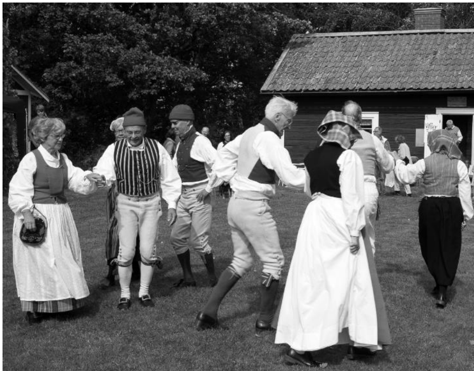
Folkdans hör verkligen till traditionen på hembygdens dag. Denna gång dansade både Knivsta Folkdanslag och Märsta Folkdansgille vid olika tillfällen under dagen.

Hembygdens dag 2019 blev en trevlig tillställning i traditionell tappning. Täppavallen fylldes av diverse trevlighet, många använde Hembygdsföreningens nya bord och blå-vita tak. Vädret var också trevligt och många besökare trivdes.