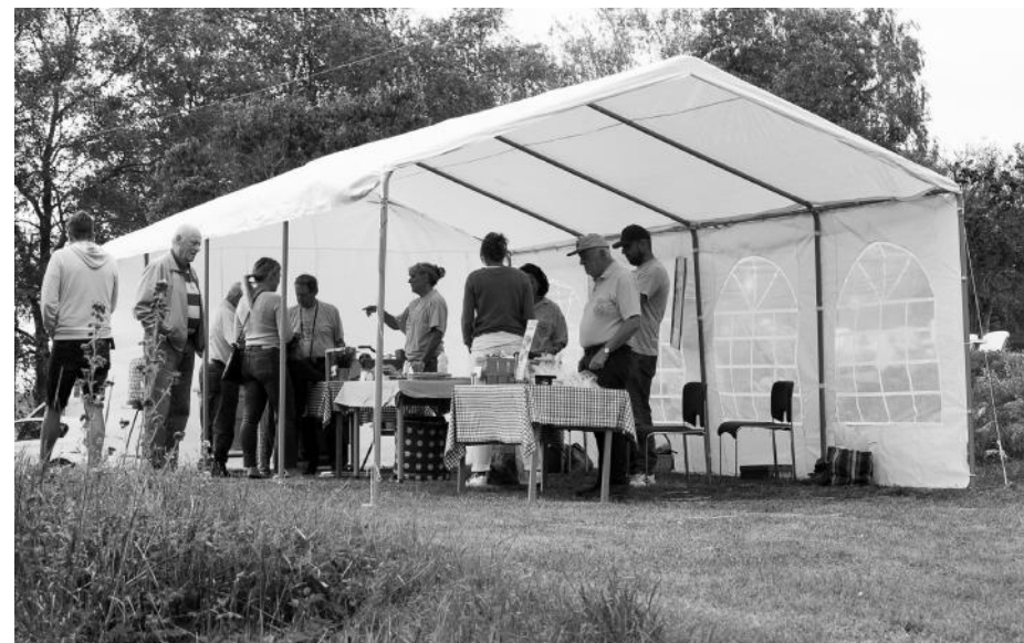
Sigtunaortens biodlare bjöd på honung och kunskaper kring biodling.